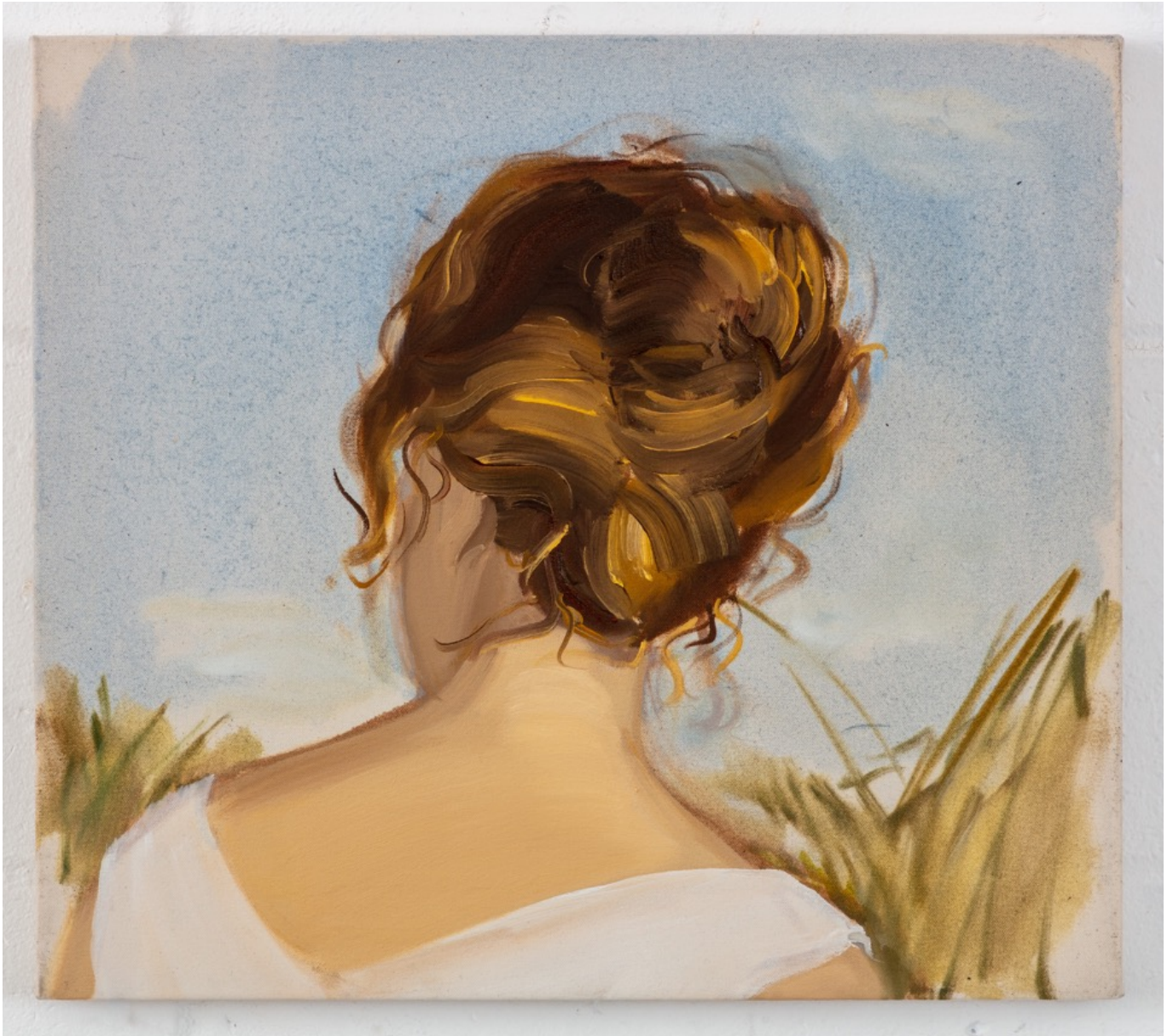
White Dress, 2023, キャンバスに油彩, 40.5 x 45.5cm ©Gideon Rubin / MAHO KUBOTA GALLERY

MAHO KUBOTA GALLERY は4月7日よりギデオン・ルービンの個展「夏の終わりの日」を開催いたします。ルービンの日本では初めての個展となるこの展覧会では11点の新作ペインティングを展示いたします。