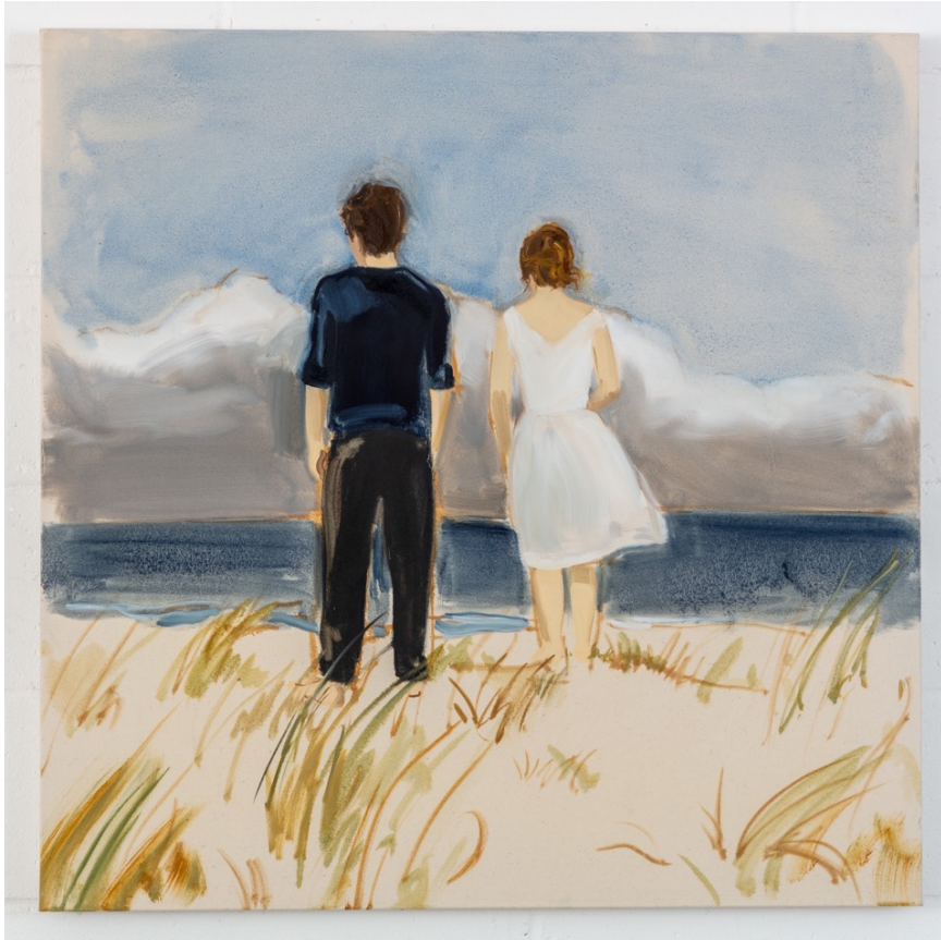
Couple on the Beach, 2023, キャンバスに油彩, 95 x 95cm